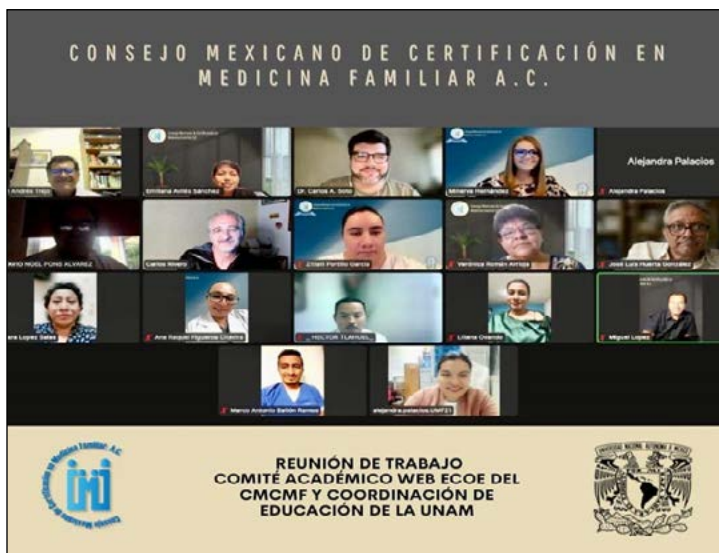
Figura 1. Capacitación Comité Académico

A partir de la pandemia en 2020-2021, la Facultad de Medicina de la UNAM, al igual que muchas otras instituciones en el mundo, se vio en la necesidad de utilizar diversas plataformas para continuar con las actividades de enseñanza y evaluación, incluyendo la evaluación práctica del examen profesional en la Carrera de Médico Cirujano, por lo que un grupo de profesores de la Secretaría de Educación Médica se dio a la tarea de desarrollar el ECOE en línea, medir su calidad psicométrica y compararlo con un ECOE presencial, resultando altamente confiable. 19 Asimismo, la Subdivisión de Medicina Familiar, de la misma Facultad, también desarrolló la misma herramienta para evaluar el