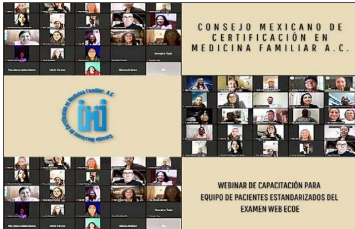
Figura III. Capacitación de pacientes simulados