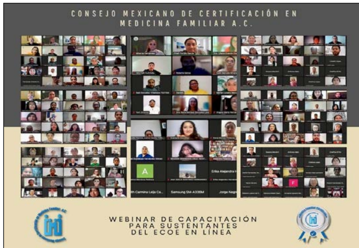
Figura V. Capacitación a sustentantes

Se aplicó una encuesta de satisfacción a los sustentantes, la cual fue respondida por 681 (79.1%), de ellos, 89% consideró que los cinco minutos entre las transiciones de sala de espera y cada una de las estaciones fueron adecuados. Del contenido del examen, los sustentantes consideraron que las estaciones evaluaban las competencias propias del médico familiar (99.3%) e informaron un alto nivel de acuerdo (82.1%) con la forma en que el ECOE en línea evalúa dichas competencias, considerando que las estaciones con mayor dificultad fueron frente a paciente 62.3%, argumentando insuficientes los 15 minutos proporcionados para las tareas asignadas. Además, 86.3% de los sustentantes consideraron que la plataforma Zoom facilitó la realización del examen.