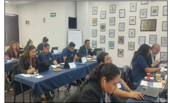
Figura VII. Un circuito de ECOE en línea y sus estaciones a evaluar

preciso de los resultados alcanzados. Se espera presentar los resultados de la evaluación, al igual que los resultados de las encuestas de satisfacción en reportes posteriores.