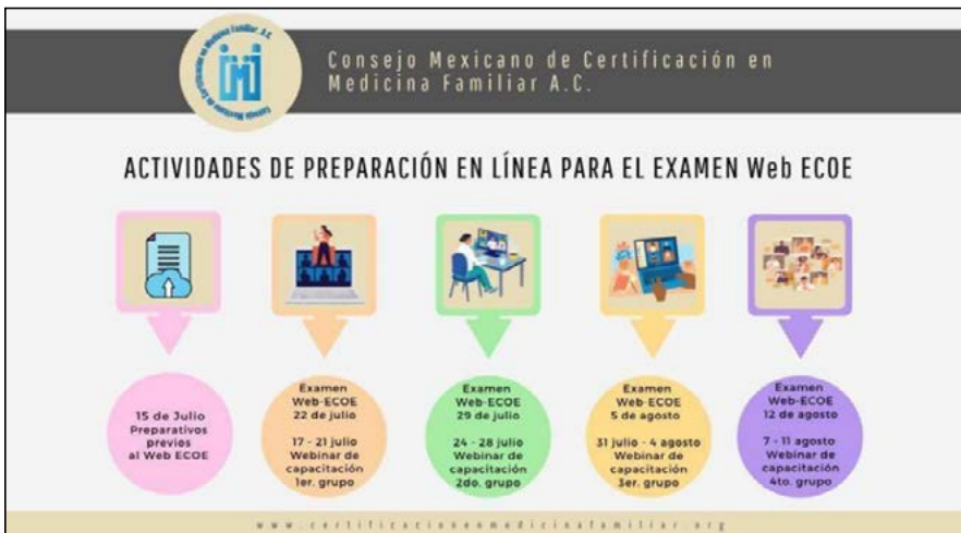
Figura IV. Cronograma de preparación Web-ECOE