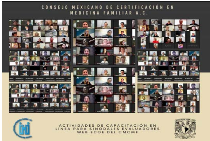
Figura II. Capacitación en línea de sinodales evaluadores

Una vez que se identificaron los temas prioritarios, se evaluó la necesidad de contar con un instrumento que permitiera evaluar el desempeño profesional del médico familiar a partir de las competencias genéricas y específicas, toda vez que desde hace 35 años solo se disponía de dos instrumentos de evaluación, por Exámenes de conocimientos y el Estudio de Salud Familiar , los cuales no permiten observar las actitudes y destrezas de los sustentantes. A partir de esta necesidad se planteó el desarrollo de un ECOE, para el cual, se incluyeron a 11 miembros de la Junta de Gobierno del CMCMF en equipos de trabajo, todos con perfil docente y de investigación, se dieron a la tarea de realizar investigación documental profunda de los temas de: familia, simulación clínica, evaluación por competencias, los principales motivos de consulta enunciados en el párrafo anterior y las experiencias vertidas en la literatura internacional al respecto de ECOE en línea.