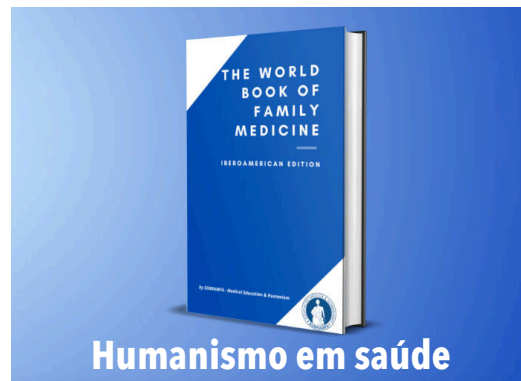
El libro «The World Book of Family Medicine. Iberoamerican edition».

La ceremonia de entrega de Premios, se celebró en el marco de la Foro Internacional SOBRAMFA–Educación Médica & Humanismo (FIS) . El libro “ The World Book of Family Medicine ” fue lanzado durante el mismo FIS, realizado el 25 de agosto de 2023. 4 En este evento participaron profesores internacionales de Medicina Familiar, donde se dieron a conocer los premios y reconocimientos. El libro (en inglés) contiene 337 páginas con 100 pautas básicas en atención primaria, organizadas en capítulos escritos por profesionales de diferentes países de América Latina y Europa. El FIS incluyó clases de diferentes temas sobre Humanismo en Salud, tales como: Humanismo en la Salud, Bioética y Humanidades, Profesionalismo médico y Actividades Culturales, como la ópera: La Traviata .